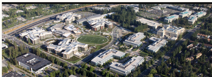
Micron MU stock record revenue fiscal 2026 · upload.wikimedia.org

이번 주 「마이크론 FY3Q26 사상 최대 실적·가이던스 상황」 이슈는 반도체 흐름을 설명하는 핵심 장면이었다. 1개 거래일에 걸쳐 반복됐고, 주간 누적 167건으로 집계됐다. 핵심은 보도량이 아니라 같은 방향의 뉴스가 며칠 동안 가격 기대를 붙잡았다는 점이다.